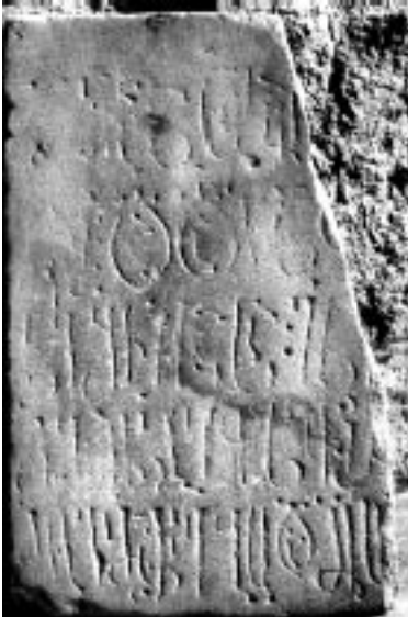
17. იერუსალიმი. წმ. ჯვრის მონასტერი. წარწერა მარმარილოს ფილაზე..

მული აზრის გამოტანა ძნელია, როგორც ჩანს, იგი სააღაპე წარწერა უნდა იყოს. მარმარილოს ფილების ეს ორი წარწერიანი ფრაგმენტი წმ. ჯვრის მონასტრის მუზეუმშია გამოფენილი, ეკლესიის ცენტრში (გუმბათის ქვეშ) იატაკიდან ამოღებულ ბრინჯაოს დისკოსთან ერთად, რომელზეც წერია: "შ[ა]ქ[ა]ნო დეგით მტკიცედ და შეურყეველად და მომიხსენ[ეთ] მე ც[ოდვილ]ი ჯ[ვარის] მამა[ე] ნიკ[იფორე]. ქ[ორონი]კ[ონ]სა ტკია, 1643".