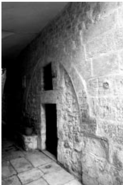
8. იერუსალიმი. წმ. ნიკოლოზის ეკლესიის დასავლეთი ფასადი.

ტიმოთე გაბაშვილის ცნობით, წმ. ნიკოლოზის მონასტერი იერუსალიმის იმ ადგილას მდებარეობს, სადაც ამ წმ. მამის სენაკი ყოფილა და იგი კახთა დედოფალს