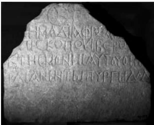
22. როკფელერის მუზეუმი. სამუელ იბერთა ეპისკოპოსის ბერძნული ეპიტაფია (ფოტო დ. ცხადაძის)

ვირჯილიო კორბოს მიერ აღმოჩენილი ბირ ელ კატის მოზაიკური წარწერები იერუსალიმის ფრანცისკელთა მუზეუმშია დაცული (ქართულ სამეცნიერო ლიტერატურაში დამკვიდრებულია სახელი "ბირ ელ კუთ" ან "ბირ ელ ყუთ", მაგრამ სი-