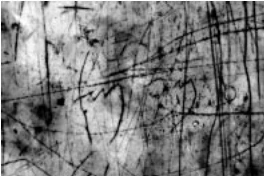
1. ბეთლემი. შობის ტაძარი. თევდორეს წარწერა.

უმეტესობა პილიგრიმული მინაწერია, თუმცა ზოგიერთი მათგანი მნიშვნელოვან ინფორმაციას შეიცავს, წარწერების ნაწილი კი ოფიციალური, საეკლესიო ხასიათისაა; გამოვლინდა აქამდე უცნობი საეკლესიო ნაქარგობის ნიმუშებიც, რომელთაც საეკლესიო წარწერები გააჩნიათ.