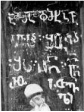
15. იერუსალიმი. წმ. ჯვრის მონასტერი. შოთა რუსთაველის წარწერა

შესრულებული. მოხსენიებულთაგან მეორე წარწერა შემდგომში თეთრი საღებავით უხეშად განუახლებიათ. განახლებულ ასოთა მოხაზულობა განსხვავებულია და წააგავს ნიკიფორე (ილ. 14) თუ ომან ჩოლოყაშვილების საქტიტორო წარწერების ასონიშნებს. ამ მხრივ საინტერესოა შოთა რუსთაველის პორტრეტთან არსებული განმარტებითი წარწერა, რომელიც თეთრი საღებავით არის შესრულებული (ილ. 15). პალეოგრაფიული ნიშნებით იგი ნიკიფორე ჩოლოყაშვილის წარწერებს უახლოვდება, მაგრამ ამ წარწერის პირველი სტრიქონის ქვეშ მოჩანს უფრო ძველი წარწერის ორი სიტყვა - "ამ[ი]სა და[მხატავსა]", რომელიც ასოთა მოხაზულობით გაბრიელ დრანდელის წარწერის მსგავსია. ცხადია, რომ შოთა რუსთაველის პორტრეტის განმარტებითი წარწერა მხოლოდ განახლებულია ნიკიფორე ჩოლოყაშვილის დროს, XVII საუკუნის 40-იან წლებში, და იგი (ალბათ, ისევე როგორც თვით პორტრეტიც) უფრო ძველია. ეს დასკვნა სავსებით ეთანხმება კედლის მხატვრობის სპეციალისტთა მოსაზრებას იმის თაობაზე, რომ ჯვრის მონასტრის მოხატულობაში ქრონოლოგიურად განსხვავებული რამდენიმე ფენა განირჩევა.