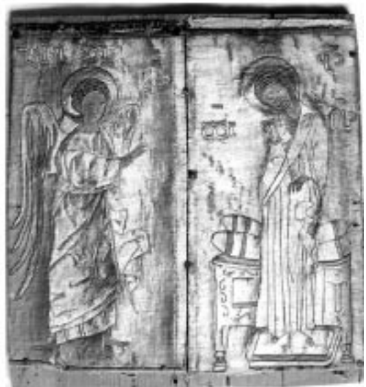
25. საბა განწმენდილის მონასტერი. ხარების ნაქარგი ხატი.

2. იერუსალიმის ბერძნული საპატრიარქოს მუზეუმის ექსპოზიციაში დაცული ენქერი (XVII ს.), რომლის ოლეს გარს შემოსდევს ფსალმუნის ტექსტი (44.3,4): "შეიბ მ[ა]ხვილი შ[ენ]ი წ[ე]ლთა შ[ენ]თა ძლიერო შეენ[ი]ერ[ე]ბითა შე[ნი]თა და სიკ[ე]თითა შ[ენ]ითა და გიძლოდის შ[ენ]."