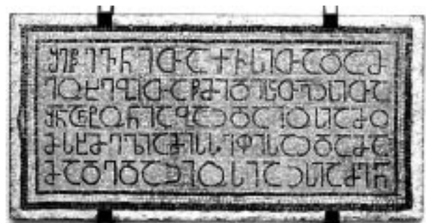
20. ბირ ელ კატი. ანტონი აბაძს მოზაიკური წარწერა

ნაზარეთის გრაფიტებზე ცნობა აკად. წ/კ ზ. ალექსიძემ მოგვაწოდა. ეს მინაწერები ქ. ნაზარეთის ხარების ახალი კათოლიკური ეკლესიის (აშენდა 1969 წ.) ადგილას V ს-ის პირველ ნახევრამდე დანგრეული ეკლესიის შელესილობაზეა შესრულებული. გადმოვიდეთ სამი მინაწერი, რომელთაგან მხოლოდ ერთია შედარებით სრულად