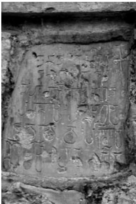
11. იერუსალიმი. წმ. ჯვრის მონასტერი. შობასშივილი შალვას წარწერა. (ფოტო გ. გავოშიძის).

ეს მონასტერი XVII ს-მდეც არსებობდა და მას ქართველები ფლობდნენ, რაზეც ნათლად მეტყველებს ეკლესიის დასავლეთის ფასადი, რომელზეც მრავალი ქართული პილიგრიმული წარწერაა ამოკვეთილი. მინაწერთა უმეტესობა XV-XVII სს-ს განეკუთვნება. ძველად ეკლესიას (XVII ს-მდე მაინც), როგორც ჩანს, დასავლეთიდან გააჩნდა ღია, თაღოვანი სტოა, რომელიც მონასტრის ახლანდელ მფლობელებს (ბერძნებს) ამოუშენებიათ (ილ. 8). ამაზე მეტყველებს ქართული წარწერების განთავსება მხოლოდ სტოის ძველ კედლებსა და თაღების ზედაპირზე. ეკლესიის ამ ფასადზე არსებულ