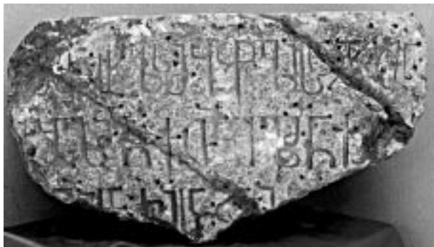
18. იერუსალიმი. კატამონი. წარწერის ფრაგმენტი.

წმ. ჯვრის მონასტრის ტაღანების დათვალიერებისას შემთხვევით მოვხვდი ეკლესიის აღმოსავლეთით დახშულ, ბნელ სივრცეში და საშუალება მომეცა გამეჩვენებინა, რომ დიდი ზომის თლილი ქვით ნაგები ეკლესიის საკურთხევლის აფსიდი გარედან სწორკუთხადაა შევრილი. ამგვარი შევრილი აფსიდი გააჩნია წმ. მიწის სხვა