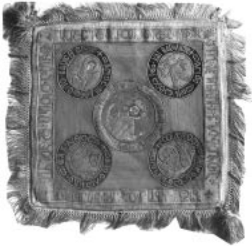
26. საბა განწმენდილის მონასტერი. ენქერი ქართული წარწერით

დ[მერთ]ო შ[ეიწყალ]ე ამა ენქერისა შემკ[ე]რ[ა]ვი, ბ[ა]ტ[ო]ნ[ი]ს შვილის გ[ა]მ[ზ]რ[დ]ელი გ[უ]ლჩინა" (ილ. 24) (ამ მუზეუმში დაცულია ასევე სამეცნიერო ლიტერატურაში კარგად ცნობილი ქართული საეკლესიო ნივთები: მაცხოვრის