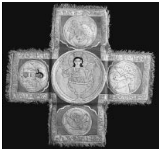
23. იერუსალიმი. წმ. ელენესა და წმ. კონსტანტინეს მონასტერი. ბაგრატიონთა ასულის, თამარის შეკვეთით შეკერილი ბარძიძის პერექელი

იერუსალიმის როკფელერის მუზეუმში საშუალება მოგვეცა ფოტოფირზე აღგვე-