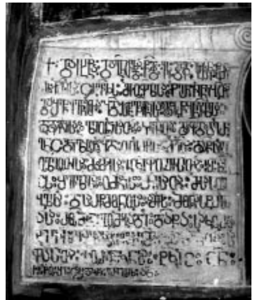
14. იერუსალიმი. წმ. ჯვრის მონასტერი. ნიკიფორე ჩოლოყაშვილის წარწერა.

ექსპედიციის მნიშვნელოვანი მონაპოვარია წმ. ჯვრის მონასტრის ფრესკული წარწერების დიდი ნაწილის სრულფასოვანი ფიქსაცია: ცელოფანზეა გადმოტანილი და ფოტოფირზეა აღბეჭდილი საქტიტორო და ფრესკული კომპოზიციების განმარტებითი წარწერების უმეტესობა. კალკაზე ვერ დავიტანე მხოლოდ ის წარწერები, რომლებიც ეკლესიის კამარებსა და მოხატულობის ზედა რეგისტრშია დაცული, მაგრამ ყველა ეს წარწერა ფოტოფირზეა აღბეჭდილი. მათ შორისაა ნიკიფორე ჩოლოყაშვილისა და