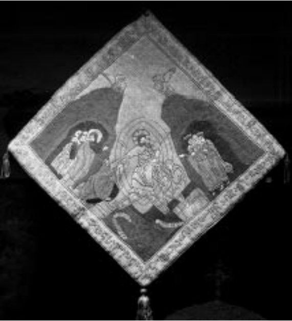
24. ბერძნული საპატრიარქოს მუზეუმი. გულჩინას შეკერილი ენქერი

ამ დროსაა აგებული ჯვრის მონასტერიც, ჯერჯერობით თითქმის არ ჩანს ამ ხანის ქართული დამწერლობის ნიმუშები, რისი მიზეზიც ამ ძეგლთა მრავალგზისი რესტავრაცია და განახლება უნდა იყოს.