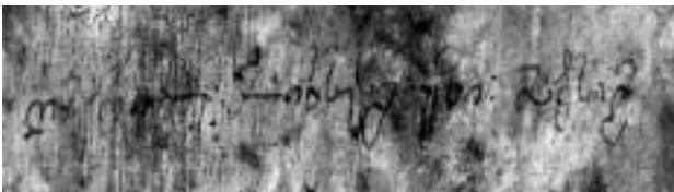
2. ბეთლემი. შობის ტაძარი. კათალიკოს მაქსიმეს წარწერა.

ბეთლემის შობის ტაძრის ადრეული შუა საუკუნეების სვეტებზე ქართველ პილიგრიმთა ბევრი მინაწერი აღმოჩნდა. აღსანიშნავია XI ს-ის ნუსხასუცურიდან მხედრულზე გარდამავალი ხელით შესრულებული ვინმე თევდორეს (ილ. 1) და ნუსხურით დაწერილი გიორგის გრაფიტები. მოხერხდა მინაწერებში დამოწმებული ზოგიერთი პირის იდენტიფიცირება. ასე, მაგალითად, ბეთლემის შობის ეკლესიის ერთ-ერთ სვეტზე აღმოჩნდა დასავლეთ საქართველოს კათალიკოსის მაქსიმე I მაჭუტაძის (1639-1657 წწ.) შავი მელნით შესრულებული მხედრული ფაქსიმილე: "ღმერთო მოიხსენიე კათალიკოსი მაქსიმე" (ილ. 2). მაქსიმე კათალიკოსმა