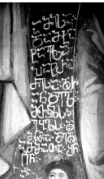
13. იერუსალიმი. წმ. ჯვრის მონასტერი. დრანდელი მთავარეპისკოპოსის წარწერა.