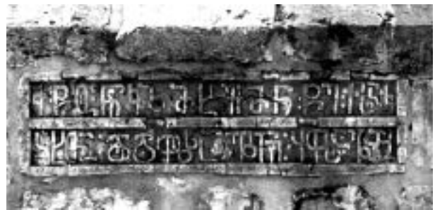
6. იერუსალიმი. წმ. ნიკოლოზის ეკლესია. აფხაზთა დედოფლის – ელენე ყოფილი ელისაბედის წარწერა.

შესაძლებელია, ამ მინაწერებში დამოწმებული ზოგიერთი პირის იდენტიფიცირება. მაგ., კარიბჭის აღმოსავლეთ წირთხლზე,