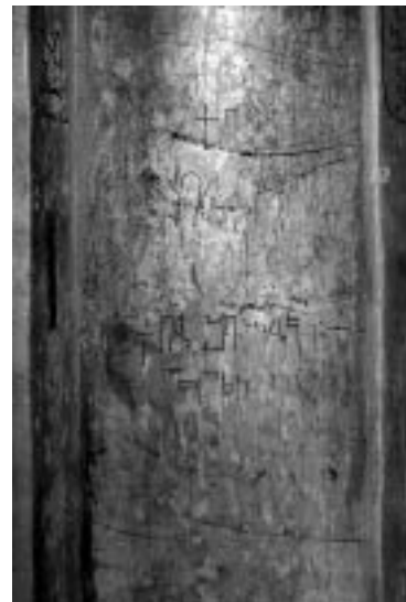
3. ბეთლემი. შობის ტაძარი. სვეტი ქართული წარწერებით.

ამავე ეკლესიის სამხრეთი სვეტნარის აღმოსავლეთიდან პირველი სვეტის (რომელიც ახლა ეკლესიის ტრანსეპტისა და სამნავიანი სივრცის გამყოფი გვიანდელი კედლის სისქეშია ჩართული) დასავლეთ მონაკვეთზე ამოკაწრულია XIV-XVII სს-ის რამდენიმე ქართული გრაფიტი (ილ. 3); წარწერებში მოხსენიებულია ვინმე იოაკიმ ქართლელი, შიო, ნიკოლოზ გძელი და