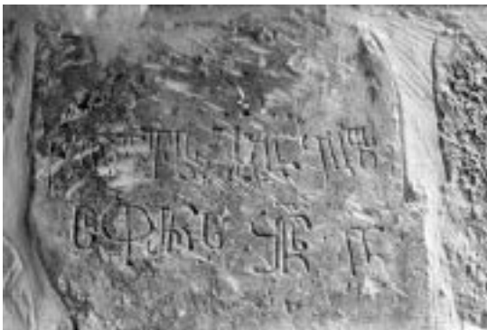
5. იერუსალიმი. წმ. ნიკოლოზის ეკლესია. საბა ყოფილი სოფრონის წარწერა

მუდმივ რემონტებს უნდა მივაწეროთ: უფლის საფლავზე 1808 წელს მომხდარ ხანძარს შეეწირა გოლგოთის საპატრიარქო საყდარი ვრცელი ქართული წარწერით; ამავე ხანძარში დაინთქა ტაძარში შესასვლელი კარიც, რომელზეც, ლავრენტი ოკრიბელის ცნობით, გიორგი მეფის წარწერა იყო და სხვ. (ნ. მარი). 1990 წელს იერუსალიმში ყოფნისას ქრისტეს საფლავის კარიბჭის სვეტებზე 15 წარწერა შევნიშნე, უკანასკნელი ექსპედიციის განმავლობაში კი კიდევ რამდენიმე გრაფიტი აღმოჩნდა. ცნობილია, რომ უფლის საფლავის ტაძარი XII ს-ში ჯვაროსნების მიერ საფუძვლიანად გადაკეთდა. ამ დროისაა ეკლესიის ერთადერთი მხატვრულად გააზრებული სამხრეთი ფასადიც, რომელიც ნ. კონდაკოვის მართებული განსაზღვრით, ადრეგუთური ხანის ხუროთმოძღვრების