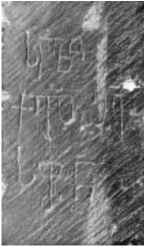
4. იერუსალიმი. ქრისტეს საფლავი. სოფრონის წარწერა

მუდმივ რემონტებს უნდა მივაწეროთ: უფლის საფლავზე 1808 წელს მომხდარ ხანძარს შეეწირა გოლგოთის საპატრიარქო საყდარი ვრცელი ქართული წარწერით; ამავე ხანძარში დაინთქა ტაძარში შესასვლელი კარიც, რომელზეც, ლავრენტი ოკრიბელის ცნობით, გიორგი მეფის წარწერა იყო და სხვ. (ნ. მარი). 1990 წელს იერუსალიმში ყოფნისას ქრისტეს საფლავის კარიბჭის სვეტებზე 15 წარწერა შევნიშნე, უკანასკნელი ექსპედიციის განმავლობაში კი კიდევ რამდენიმე გრაფიტი აღმოჩნდა. ცნობილია, რომ უფლის საფლავის ტაძარი XII ს-ში ჯვაროსნების მიერ საფუძვლიანად გადაკეთდა. ამ დროისაა ეკლესიის ერთადერთი მხატვრულად გააზრებული სამხრეთი ფასადიც, რომელიც ნ. კონდაკოვის მართებული განსაზღვრით, ადრეგუთური ხანის ხუროთმოძღვრების