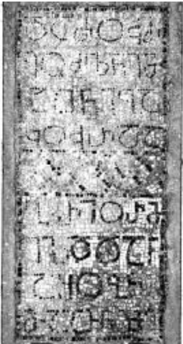
21. ბირ ელ კატი. ბაკურისა და გრიორმიზდის მოზაიკური წარწერა

შემონახული: "შ[ე]იწყალე ი[ეს]უ ქ[რ]ისტე ..გ". ზ. ალექსიდის აზრით, ამ წარწერის ბოლო დაქარაგმებული სიტყვაა "გიორგი". თუ ეს ასეა, მაშინ საქმე გვაქვს ქართულ სინამდვილეში უადრეს გამოყენებასთან ამ სახელისა, რომელიც შემდგომში საქართველოს თითქმის ეთნონიმად იქცა.