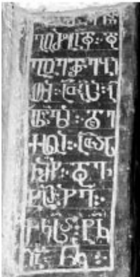
12. იერუსალიმი. წმ. ჯვრის მონასტერი. წარწერა გუმბათის მშენებლობის შესახებ.