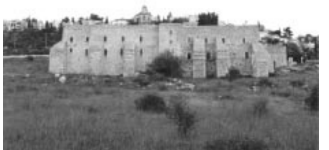
4. წმ. ჯვრის მონასტრის საერთო ხედი

წმ. ჯვრის მონასტერი, რომელიც საუკუნეთა განმავლობაში ქართველთა მოღვაწეობის მთავარი ცენტრი იყო წმ. მიწაზე, ძველი იერუსალიმიდან ხუთიოდე კმ-ის დაშორებით მდებარეობს (ილ. 1, 4). ტრადიციით, მონასტრის