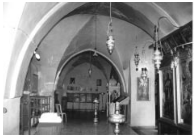
2. წმ. ნიკოლოზის ეკლესიის ინტერიერი

არის ცნობები წმ. საფლავსა და გოლგოთაზე ქართველთა სამშენებლო აქტივობის