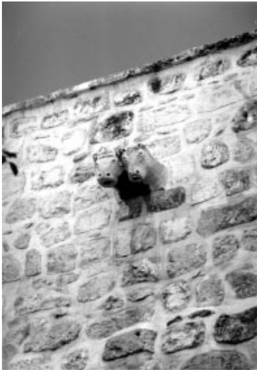
8. განშოლტვის ეკლესია. ჩრდილოეთი ფასადის რელიეფები

გონებს X-XI საუკუნეებში ჩვენს არქიტექტურაში გავრცელებულ ცხოველთა საფასადო გამოსახულებებს – ზემო კრიხის, ზენობნის, კვირიკეწმინდის ეკლესიის ფიგურებს. აშკარაა, რომ ქანდაკებები XIX საუკუნეში ხელახლა გამოიყენეს, მაგრამ მათი წარმომავლობა გაურკვეველია. არ მოიპოვება განშოლტვის ეკლესიასთან ქართველების კავშირის დამადასტურებელი არცერთი ცნობა. ისიც გასათვალისწინებელია, რომ ეს ეკლესია დგას მუსლიმურ უბანში, სადაც ქართველებს თითქოსდა მონასტრები არ ჰქონიათ. შესაძლოა, ქანდაკებები ფრანცისკელებმა გადმოიტანეს სხვა რომელიმე ეკლესიიდან, რომელიც ადრე ქართველებს ეკუთვნოდა.