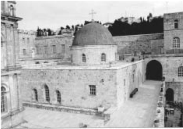
1. ჯვრის მონასტრის მთავარი ტაძარი

– სულ მცირე, ნაგებობის ფასადების მოხილვაც კი მხოლოდ ქალაქის სხვადასხვა ქუჩიდან და სხვადასხვა დონიდან არის შესაძლებელი და ისიც არა ყოველთვის. ამას უკავშირდება სამონასტრო ეკლესიების მასათა კომპონირებაც – მათ უმრავლესობას სწორკუთხოვანი კორპუსი და მასზე ზემოდან ცალკე მოცულობად "შემოდგომული" გუმბათი აქვს. (ილ.1) თავისებურად ფორმირდება ინტერიერიც. შიდა სივრცე, როგორც წესი, შედგება ჯვრული კამარებით გადახურული მომცრო მონაკვეთებისაგან, რომლებიც უჯრედებივით ებმის ერთმანეთს და სხვადასხვა მიმართულებით ვითარდება – ისე, რომ არ ქმნის ერთიან სივრცეს. (ილ. 1, 2) იერუსალიმური არქიტექტურის საერთო სახეს დიდწილად განაპირობებს ასევე ტრადიციული მასალა – თეთრი კირქვა, რომლითაც აქ უძველესი დროიდან აგებდნენ და რომლის გამოყენებასაც დღეს მშენებლებს კანონი ავალდებულებს.