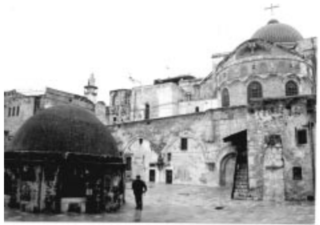
3. უფლის საფლავის ეკლესია. ხედი აღმოსავლეთიდან

იერუსალიმური ზეპირი ტრადიცია დღემდე ინახავს ხსოვნას იმისას, რომ ახლანდელი მაცხოვრის მონასტერი (St. Salvator) და მთელი მიმდებარე უბანი ერთ დროს ქართველებისა იყო. მონასტრის ეკლესია ძირეულად გადააკეთდა XIX საუკუნეში და ახლა მის არქიტექტურაში შუასაუკუნეობრივი სიძველე არსად ჩანს. მის უკან მონასტრის ეზოა, რომელშიც სამრეკლო დგას. XIX საუკუნის ზოგი ავტორის – მაგალითად, გრაფ მელქიორ დე ვოგის – ცნობით, ფრანცისკელთა მიერ ჩატარებული რამდენიმე საფუძვლიანი რეკონსტრუქციის მიუხედავად, მონასტრის სამრეკლო იმხანად კიდევ ინარჩუნებდა ქართული არქიტექტურისათვის დამახასიათებელ ცალ-