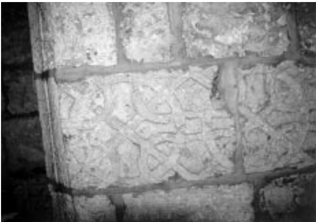
6. საიდნაია. ეკლესიის კარის მორთულობა

წმ. ჯვრის მონასტერი წარმოადგენს ჩაკეტილ არქიტექტურულ კომპლექსს ეკლესიით, სამრეკლოთი, მრავალრიცხოვანი დამხმარე სათავსებით და ვრცელი ეზოთი. ეკლესია გარედან წმ. მიწის მართლმადიდებელთა ეკლესიების უმეტესობის მსგავსად, წარმოადგენს დაუნაწევრებელ კუბურ მოცულობას, რომელზეც მხოლოდ გუმბათი აღიმართება. ინტერიერი გაცილებით უფრო საინტერესოა. შენობა "ჩახაზული ჯვრის" ტიპისაა, ორ თავისუფლად მდგარ ბურჯსა და აფსიდის კედლებზე დაყრდნობილი გუმბათით. გადახურვა გვიანდელია, მაგრამ შესაძლოა თავდაპირველი – XI საუკუნისა – იყოს შეისრული გუმბათქვეშა თაღები. საგულისხმოა, რომ ეს ფორმა, რომელსაც ფართოდ იყენებდნენ X-XII საუკუნეების ქართველი მშენებლები, შუაბიზანტიურ არქიტექტურაში მიღებული არ