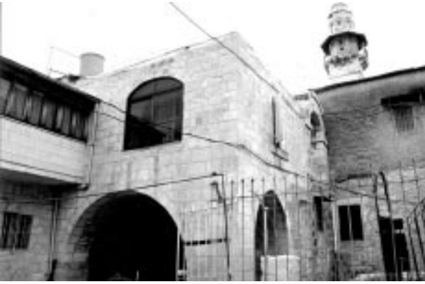
5. საიდნაიას მონასტრის საერთო ხედი (ფოტო ნ. ვახეიშვილის)

ადგილი მოიგო მირიან მეფემ, ხოლო მონასტერი დააარსა ვახტანგ გორგასალმა. წერილობითი ცნობებით, მონასტერი ააშენა ქართველმა ბერმა პროხორემ XI საუკუნის II მეოთხედში. 1305-1311 წლებში ის ადაღინა მეფე დავით VII-მ.