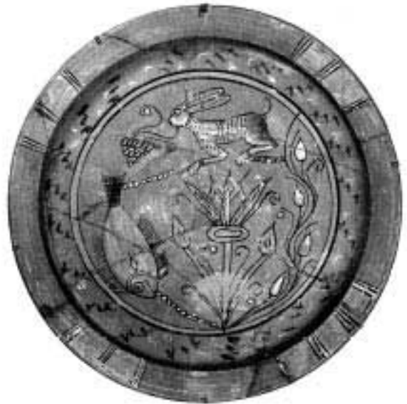
1. კოპტური მოხატული თევზი. VII ს.

ყველა ზემოთ ჩამოთვლილი თვისება და მასთან დაკავშირებული თემა (განსაკუთრებით კი მისი წილხვედრობა მთვარესთან) მას კოსმიურ წრებრუნვასთან აკავშირებს და მისი კოსმოლოგიური სიმბოლიზმი უდავო ხდება. იგი თავის