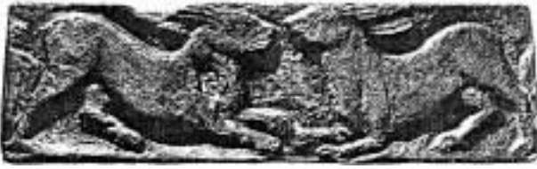
2. ოშკის რელიეფი კურდღლების გამოსახულებით. X ს.

ზოგადად სიმბოლოებში სხვადასხვა დონის ეპიფანიების ამგვარი გაერთიანება, როგორც ეს მ. ელიადემ შეისწავლა, არ ნიშნავს აღრევას, შერევას ან უწესრიგობას. სიმბოლიკა უშვებს გადასვლას, წრებრუნვას სხვადასხვა დონეზე. იგი ამ დონეებისა და სფეროების ინტეგრაციას ახდენს და არა ერთმანეთში აღრევას 11 . ქართულ ტრადიციაში იგი, როგორც ზომომორფული (დეკორატიული) მოტივი V საუკუნიდან მოყოლებული XI საუკუნის ჩათვლით გვხვდება ქრისტიანულ ხუროთმოძღვრულ ძეგლებზე (ბოლნისის სიონი, ატენის სიონი, ოშკი, ზეგანი, იშხანი, გომარეთი) 12 ასევე, მინიატურებსა და ტორევეტიკაში 13 . აღსანიშნავია, რომ აღრინდელ ეკლესიებში კურდღელი ეკლესიის შიდა სივრცის მორთულობაში ფიგურირებს, ხოლო მოგვიანებით ის ტაძრების ექსტერიორზე ინაცვლებს (ილ. 2, 3).