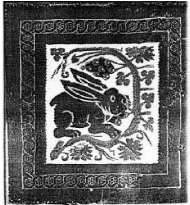
4. „კურდღელი ტკვირავს ყურძნის მტევანს“. კობტური ქსოვილი. VII ს.

რაც შეეხება ზემოთ ხსენებულ ხვიარა მცენარეს, ჩვენი აზრით, სიმბოლოს ლოგიკიდან გა-